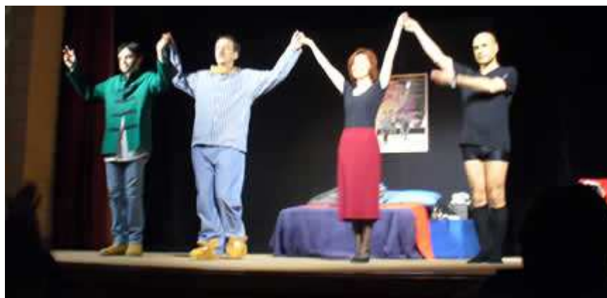
Gli attori si presentano al termine dello spettacolo

Sabato sera il Teatro San Luigi di Pagnano ha ospitato il secondo appuntamento della rassegna teatrale "Città di Merate" nata dalla collaborazione tra l'Assessorato alla Cultura del Comune di Merate e l'associazione culturale "Il Sipario".